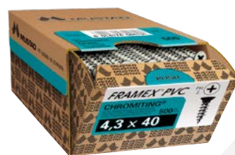
VITI PER SERRAMENTI IN PVC