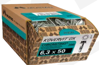
VITI KOVERVIT® PER EDILIZIA E COPERTURE