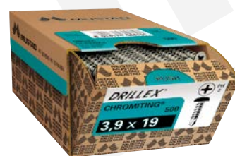
VITI DRILLEX® AUTOFORANTI PER LAMIERA