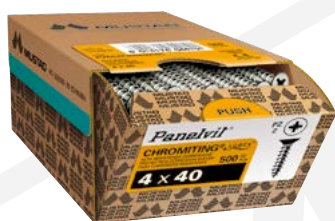
VITI PANELVIT® UNIVERSALE